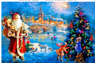
Аргъау – сказка